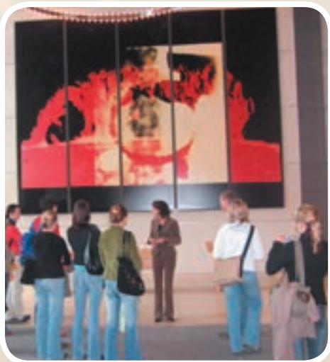
Studenci w trakcie zwiedzania Parlamentu Niemieckiego (Reichstagu) w Berlinie

Owocnie rozwija się współpraca z Uniwersytetem Bolońskim dzięki udziałowi studentów w corocznie organizowanej Międzynarodowej Szkole Letniej. Podróże grupowe do Niemiec organizowane w ramach Programu DAAD (Niemiecka Centrala Wymiany Akademickiej) umożliwiają studentom doskonalenie kompetencji językowych oraz pogłębiają ich wiedzę z zakresu naukowego, gospodarczego, politycznego oraz kulturalnego życia Niemiec. Podczas zagranicznych praktyk zawodowych m.in. w Szwajcarii, Wielkiej Brytanii, Irlandii, Niemczech studenci doskonalą praktyczne umiejętności oraz zbierają nowe doświadczenia zawodowe.