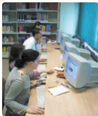
Sala komputerowa w bibliotece

Wspiera proces dydaktyczny oraz działalność naukową przez publikowanie monografii naukowych, podręczników i skryptów z zakresu dyscyplin należących do głównych obszarów kształcenia. Regularnie publikuje kwartalnik Leszczyński Notatnik Akademicki oraz periodyk naukowy Scripta Comeniana Lesnensia .