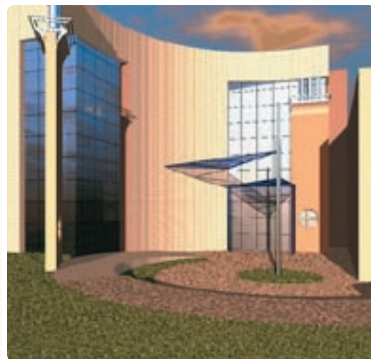
Projekt budowy Biblioteki Uczelnianej