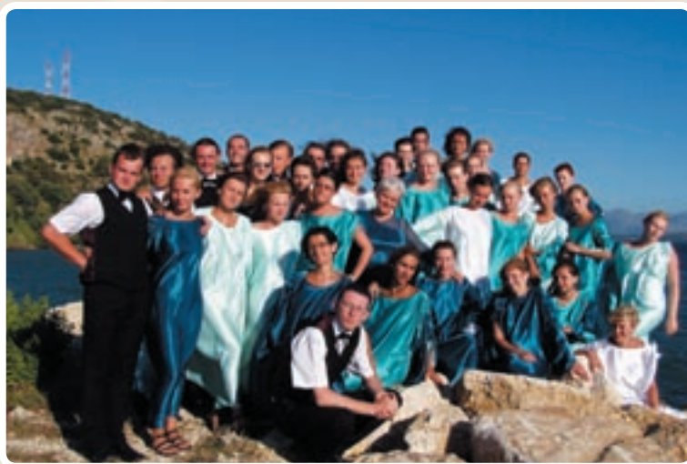
Chór Uczelniany w Grecji

Wspierana przez uczelnię drużyna żeńskiej koszykówki PWSZ - Duda Leszno występuje w rozgrywkach ekstraklasy państwowej.