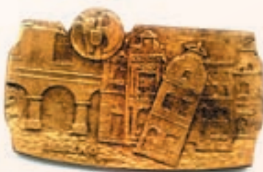
Medal za zasługi dla PWSZ im. J.A.Komeńskiego w Lesznie