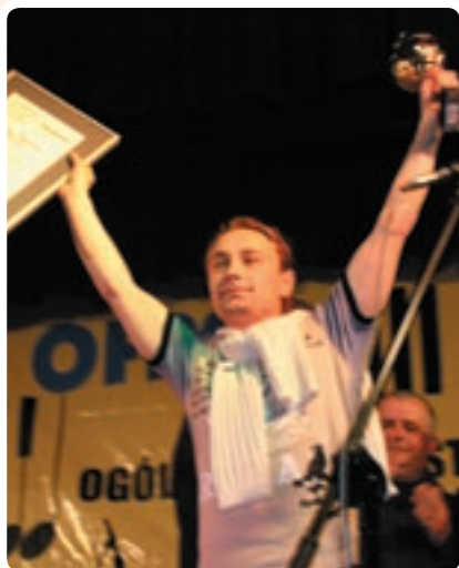
IV Ogólnopolski Festiwal Piosenki Studenckiej

Na uczelni działa teatr studencki PROFORMA . Zespół muzyczny Big-Band , złożony z artystów doskonałych swój warsztat pod opieką profesorów Instytutu Muzyki, zapewnia doskonałą oprawę muzyczną wielu przedsięwzięciom kulturalnym i naukowym.