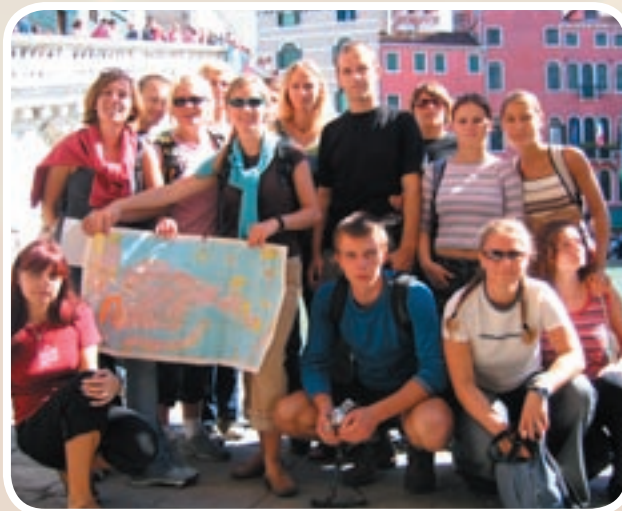
Uczestnicy Summer school w Rimini (Włochy)