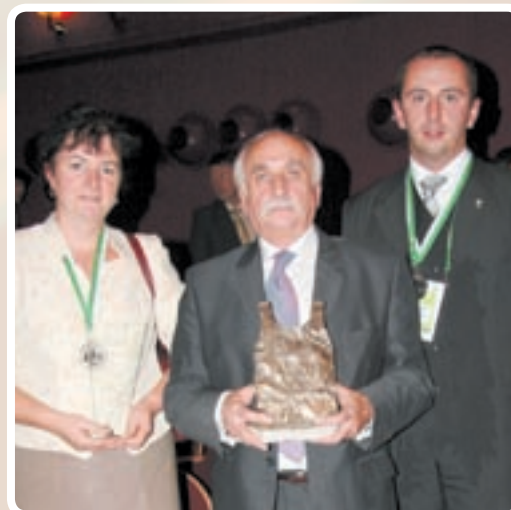
XXXIII Mistrzostwa Polski Szkół Wyższych – II miejsce PWSZ im. J.A.Komeńskiego w Lesznie w kategorii uczelni pedagogicznych.