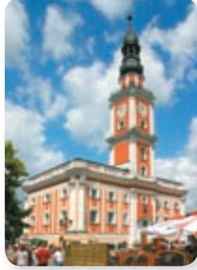
Rynek i ratusz leszczyński