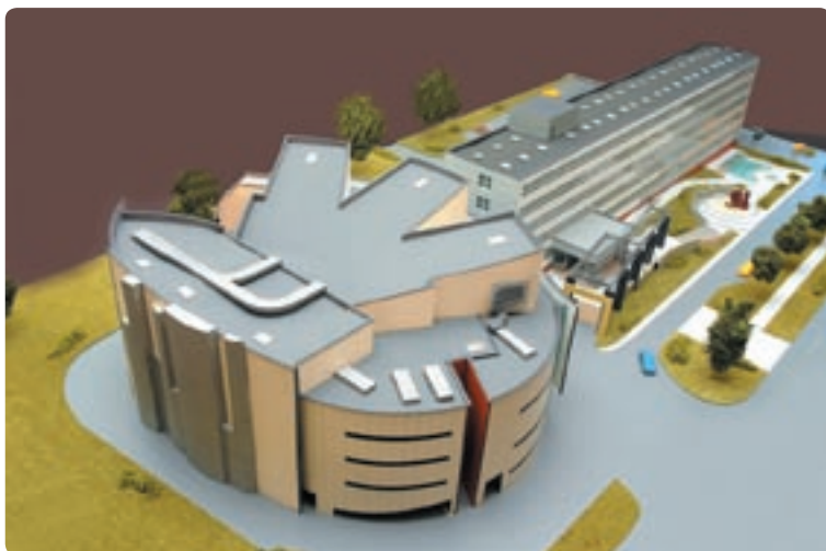
Projekt budowy wielofunkcyjnej auli z zespołem sal wykładowych

Uczelnia przygotowała też projekt budowy nowoczesnej, wielofunkcyjnej auli z zespołem sal wykładowych.