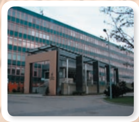
Budynek główny PWSZ im. J.A. Komeńskiego w Lesznie