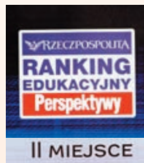
Dyplom dla PWSZ im. J.A. Komeńskiego w Lesznie za zajęcie II miejsca w rankingu publicznych uczelni zawodowych w 2006 roku